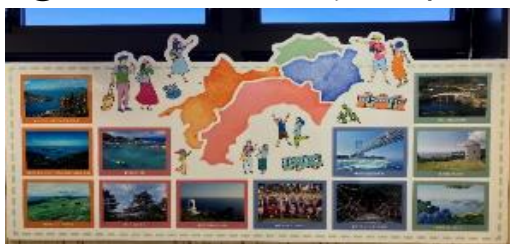
⑤SA・PAの多目的スペースの活用