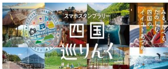
③スマホスタンプラリー 「四国巡りんく」