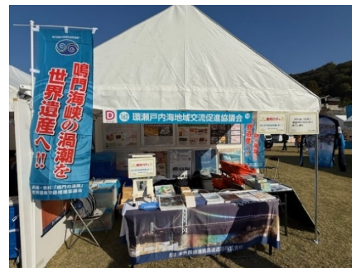
③えひめ・まつやま産業まつり