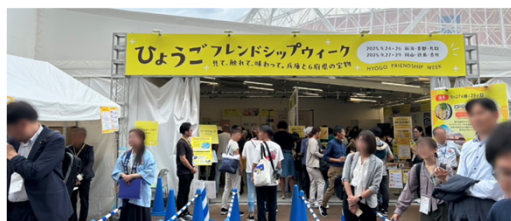
①ひょうごフレンドシップウィーク