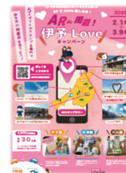
④電子スタンプラリー AR de 周遊！ 伊予 Love キャンペーン