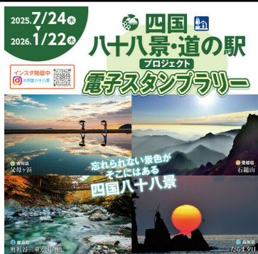
①四国八十八景 電子スタンプラリー