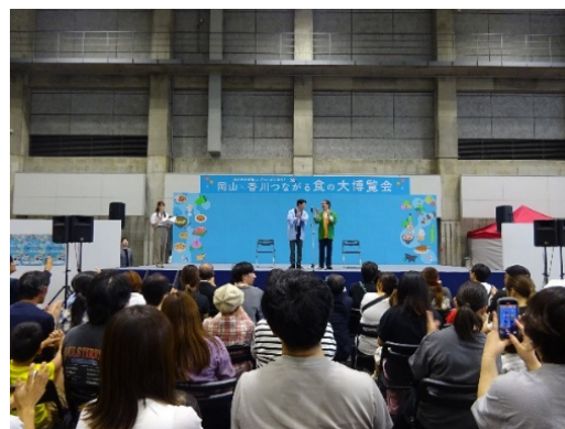
②岡山×香川つながる食の 大博覧会食の大博覧会