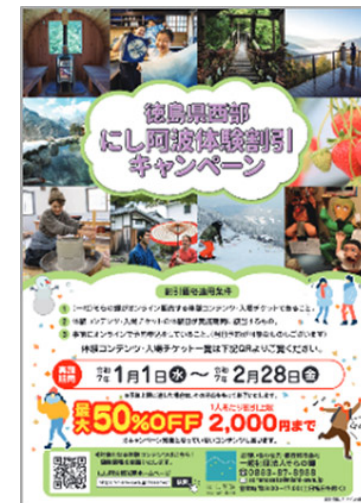
④ドライブパスでにし阿波へ