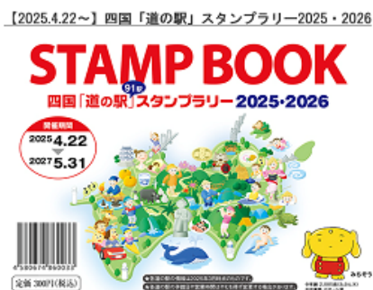
②四国「道の駅」 スタンプラリー