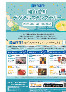
⑤WESTER岡山 香川デジタル スタンプラリー